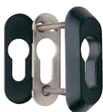
Detalle del escudo E210